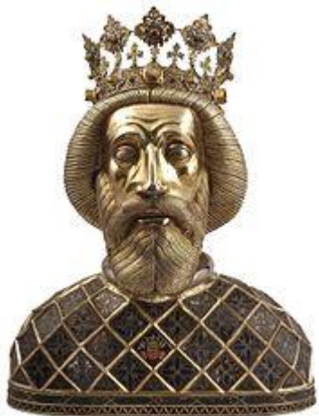
Szent László hermája